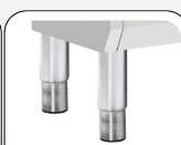
Piedi in acciaio inox regolabili opzionali