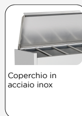
Coperchio in acciaio inox