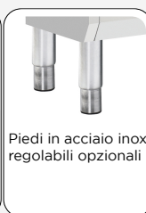
Piedi in acciaio inox regolabili opzionali