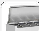
Coperchio in acciaio inox