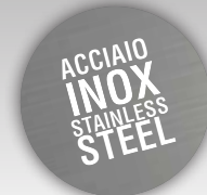
VULCANO VS80 - SL SALUMI E LATTICINI DAIRY PRODUCTS

DISPONIBILI ANCHE IN ACCIAIO INOX STAINLESS STEEL VERSION AVAILABLE