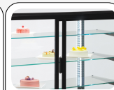
Porte scorrevoli posteriori in Thermopane