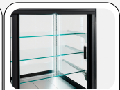
Ripiani in vetro refrigerati